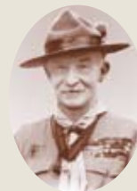
創始者 ロバート・ベアデン・パウエル

ボーイスカウト運動は1907年、イギリスから始まり世界中に拡がり、現在では世界の160の国と地域が正式加盟、約2,800万人ものスカウトが参加しています。社会教育団体としては他に例を見ないほど国際性を持ち、その意義が広く認められています。環境教育や国際理解・国際協力のプログラムを積極的に展開し、国連の諸機関と協力し、国際協力活動も行っています。