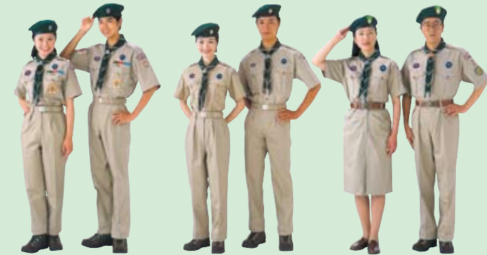
ベンチャースカウト 中学校3年生の9月から