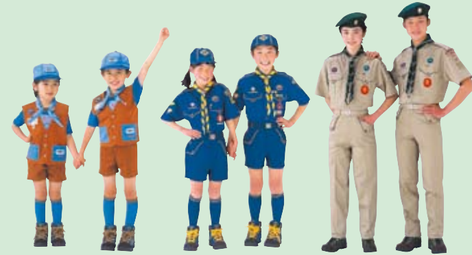
ビーバースカウト 小学校1年生の 就学直前9月から