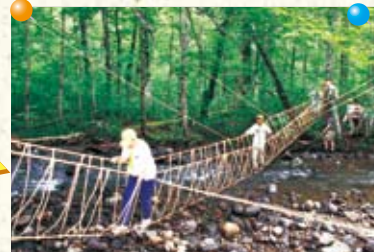
【モンキーブリッジ】